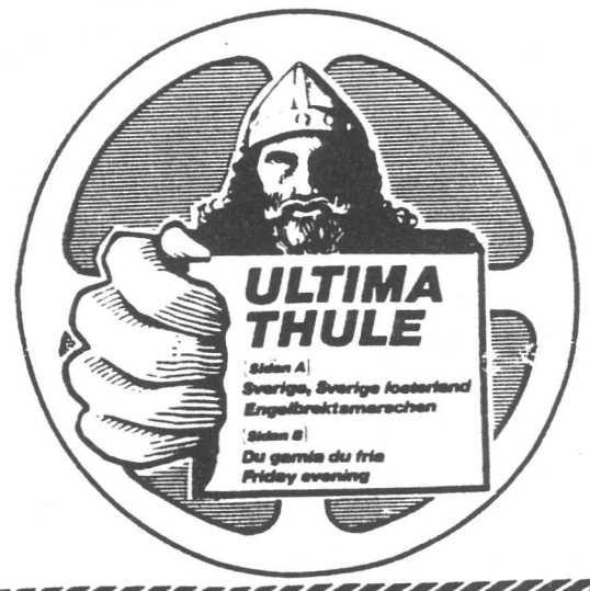
Ultima Thules EP-skiva