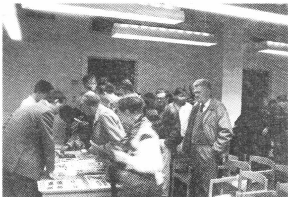
Paus i mötet med Sthlm norra