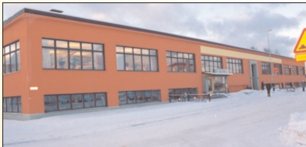
Dalagatan 1. Sverigedemokraterna röstade nej till "Dalagatan 1" när frågan kom upp i kommunfullmäktige. Vi kommer att fortsätta verka för att alla företagare ges lika villkor av kommunen.

En del äldre drogmissbrukare har flyttat till kommunen, och detta kan ha ett samband med att ungdomar använder droger mer än tidigare. Orsabostäder bör vara vaksamma på vilka som vill hyra lägenhet. Byggnadsnämnd och hälso- och miljöskydds-nämnd ska vara vaksamma på vilka som flyttar in i hus ute i bygden.